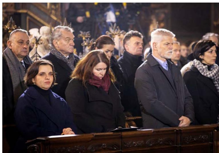
23. 12. 2023 Requiem v katedrále sv. Víta, Václava a Vojtěcha v Praze.