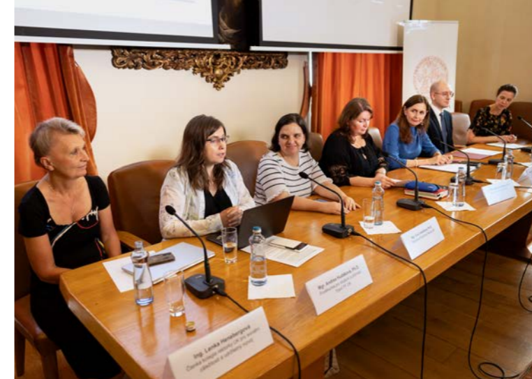
21. 6. 2024 Půl roku od tragické události Univerzita Karlova představila Centrum resilience, jehož cílem je posilovat odolnost studujících, vyučujících a všech zaměstnanců a zaměstnankyň. Více na straně 38.