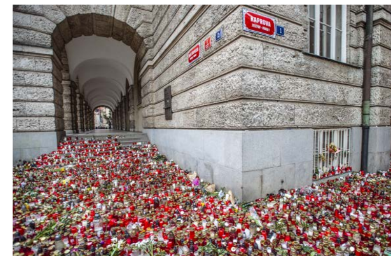
4. 1. 2024 Pietní průvod, symbolické obětí fakulty a zapálení ohně na náměstí Jana Palacha. Tímto tichým setkáním několika tisíc lidí odstartoval Měsíc pro fakultu.