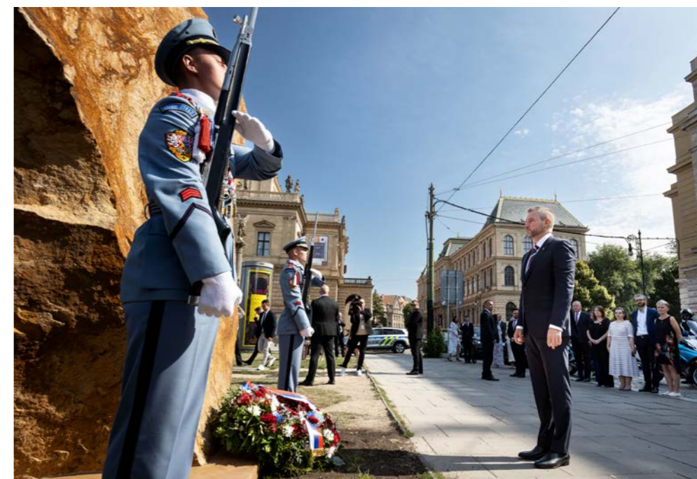
26. 6. 2024 Pět dní po odhalení obelisku coby pietního místa před budovou FF UK se památce obětem uklonil nový prezident Slovenské republiky Peter Pellegrini.