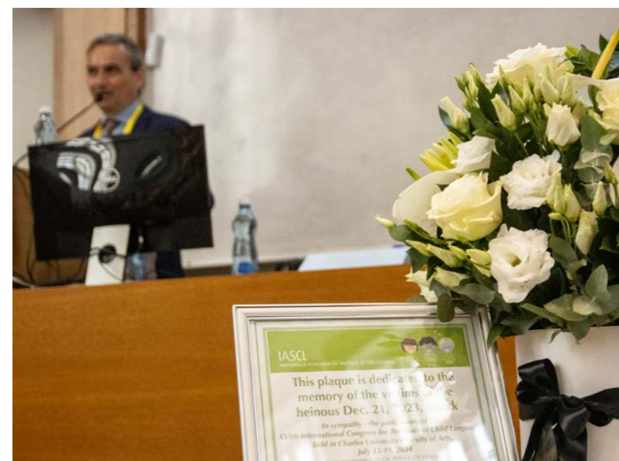
15.–19. 7. 2024 Obnovu akademického života na FF UK také v mezinárodním hledisku potvrdil i Mezinárodní kongres pro studium dětského jazyka. Organizátoři věnovali FF UK kondolenční kytky, která byla po dobu celé konference vystavena v aule hlavní budovy.