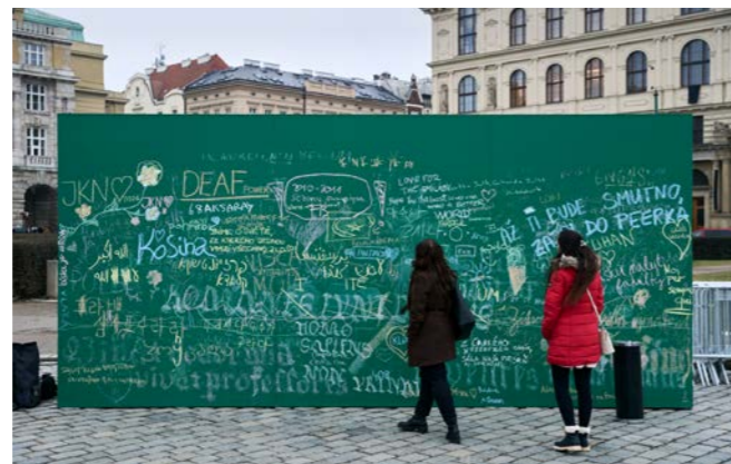
30. 1. 2024 Zakočení pietního ohně