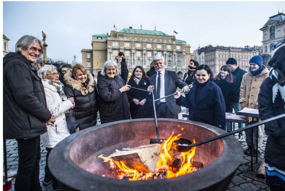
leden 2024 Vosk z tisíců svíček zapálených za oběti tragédie se postupně měnil v dočasnou pietní instalaci Společná krajina. Odlévání se zúčastnil i prezident Petr Pavel.