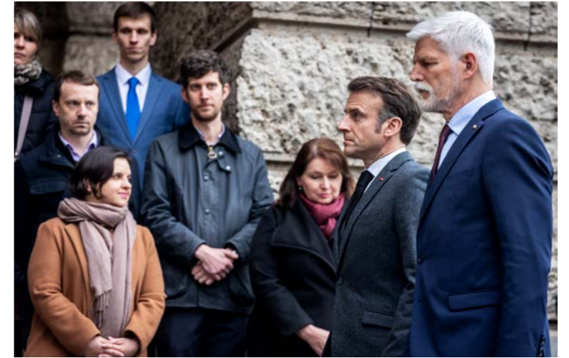
březen & duben 2024 Památku obětí tragédie uctila i řada světových státníků. Květiny u budovy Filozofické fakulty položili francouzský prezident Emmanuel Macron (5. 3.), dosluhující prezidentka Slovenska Zuzana Čaputová (18. 3.) nebo prezident Německa Frank-Walter Steinmeier (29. 4.).