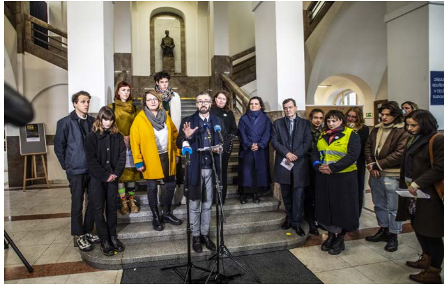
21. 1. 2024 Měsíc po tragédii se poprvé do hlavní budovy FF UK vrátili studující i vyučující, konaly se krátké přednášky i výměna knih. Na doporučení psychologů se takto postupně do budovy navrátil akademický život a posílily vazby komunity.