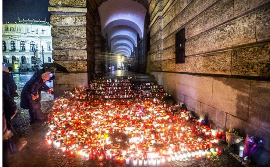
22. 12. & 23. 12. 2023 Lidé den po tragédii na FF UK přinášeli a zapalovali svíčky u brány Karolína a před budovou Filozofické fakulty na Palachově náměstí.