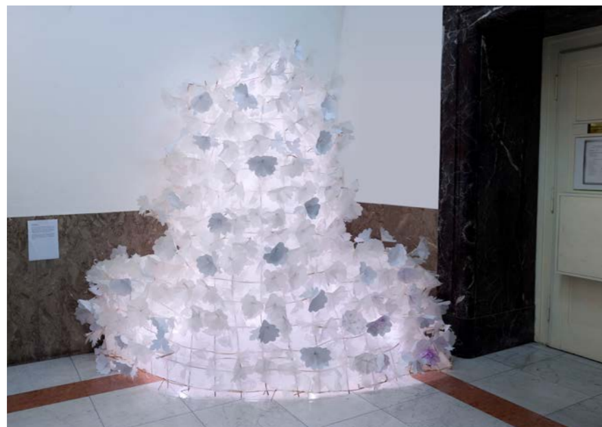
leden 2024 V prvním patře budovy Filozofické fakulty je instalován osvětlený objekt s papírovými květy kakostu, který vznikl pod vedením oborů čeština v komunikaci neslyšících a jazyky a komunikace neslyšících ve spolupráci s umělci. Kakost český po požáru jako první vyrůstá na vzniklém spáleníšti a představuje metaforu obnovy akademického života na FF UK. Detaily instalace jsme použili na předsádky tohoto čísla magazínu.