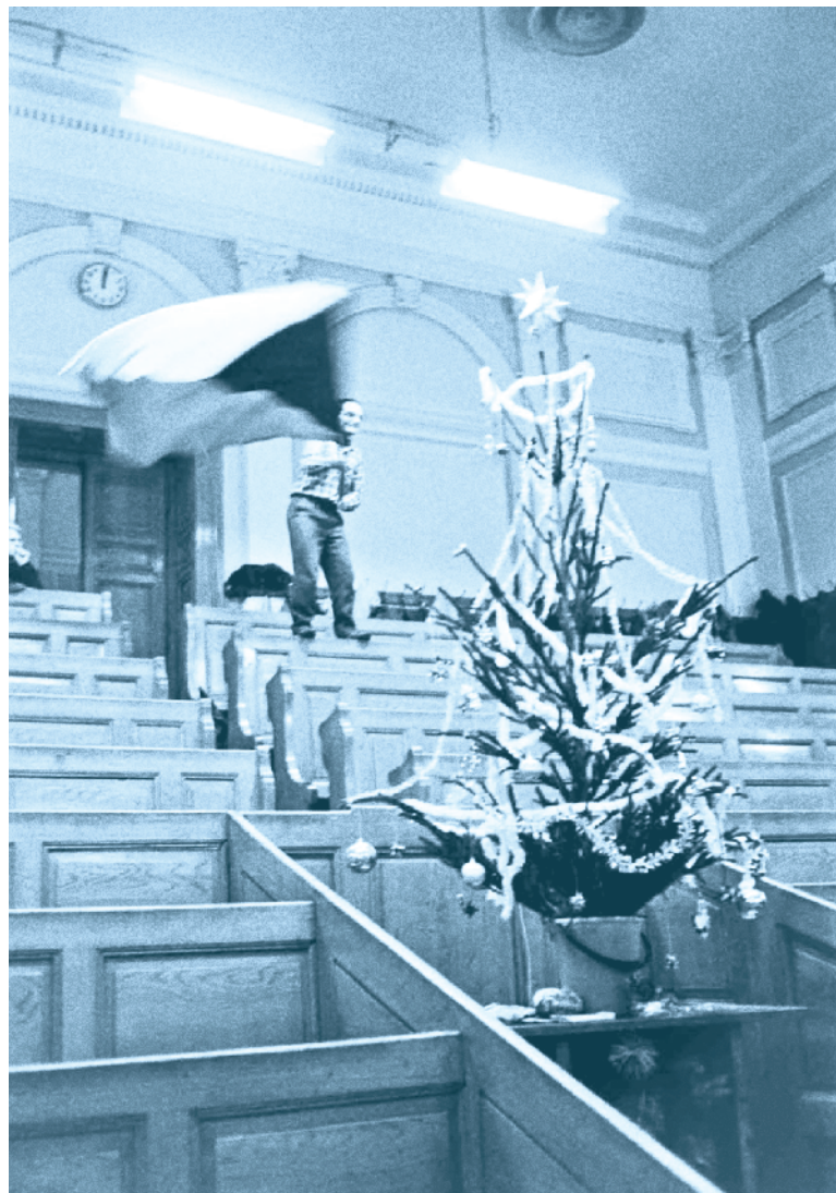
Naděje. Před Vánoci 1989 ovládla univerzitní auly euforie z očekávaných změn.