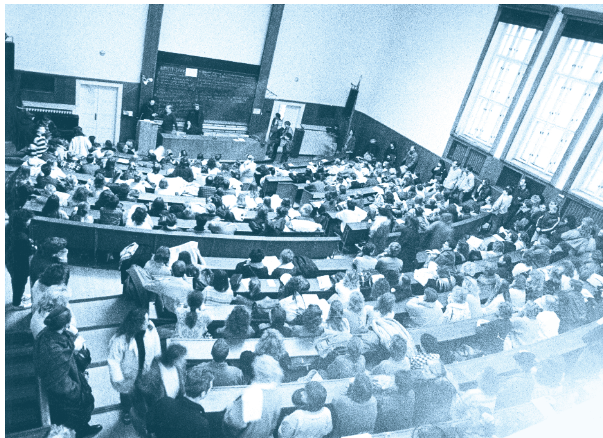
Ke studentské revoluci patřily diskuze, jednání a zaplněné přednáškové sály – tak jako na FF UK

Díky investicím i strukturálním fondům Evropské unie vzniká v jednadvacátém století moderní zázemí včetně laboratoří, které slouží nejen Univerzitě Karlově, nýbrž celé svobodné společnosti.