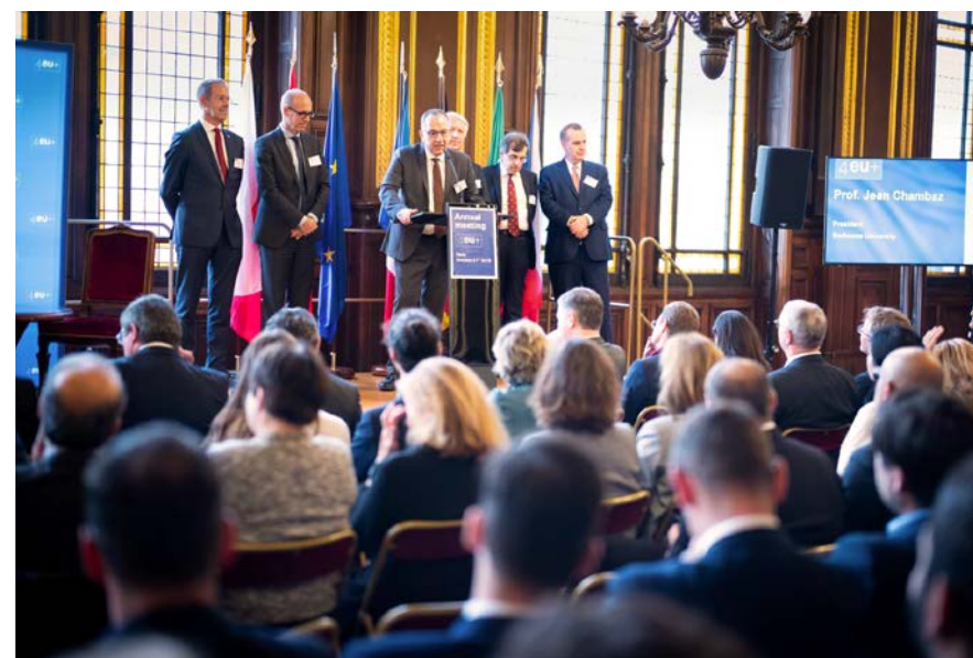
Rektoři šesti univerzit aliance 4EU+ (vpravo stojí Tomáš Zima) představili v říjnu své vize v Paříži