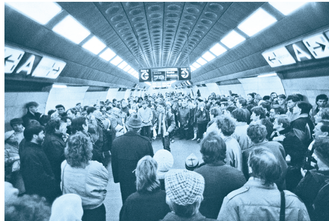
Debatovalo se všude, i ve stanicích metra