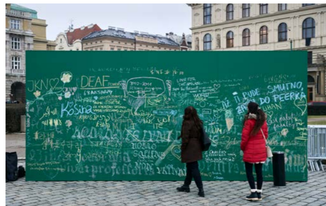
30. 1. 2024 Zakoření pietního ohně