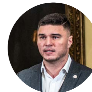
Otomar Sláma, šéf Ústředního krizového štábu UK