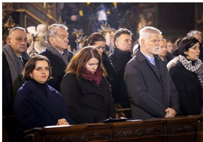
23. 12. 2023 Requiem v katedrále sv. Víta, Václava a Vojtěcha v Praze.