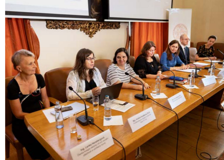
21. 6. 2024 Půl roku od tragické události Univerzita Karlova představila Centrum resilience, jehož cílem je posilovat odolnost studujících, vyučujících a všech zaměstnanců a zaměstnankyň. Více na straně 38.