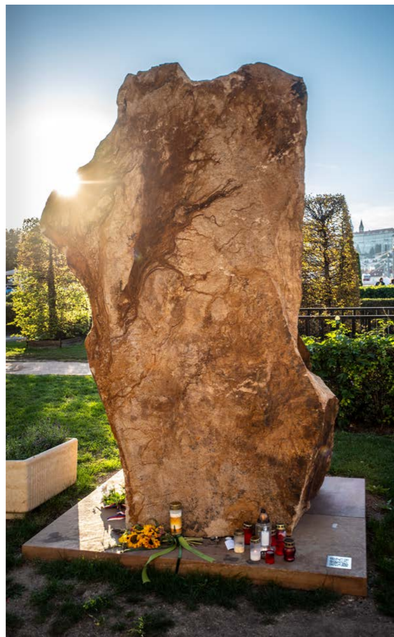
21. 6. 2024 Na náměstí Jana Palacha byl představen dočasný pietní objekt, surový monolit z pískovce, který bude pozůstalým, akademické obci a veřejnosti k dispozici do doby, než vznikne stálá připomínka obětí tragédie. Kámen je co nejméně opracovaný a po domluvě s pozůstalými se v čase může proměňovat.