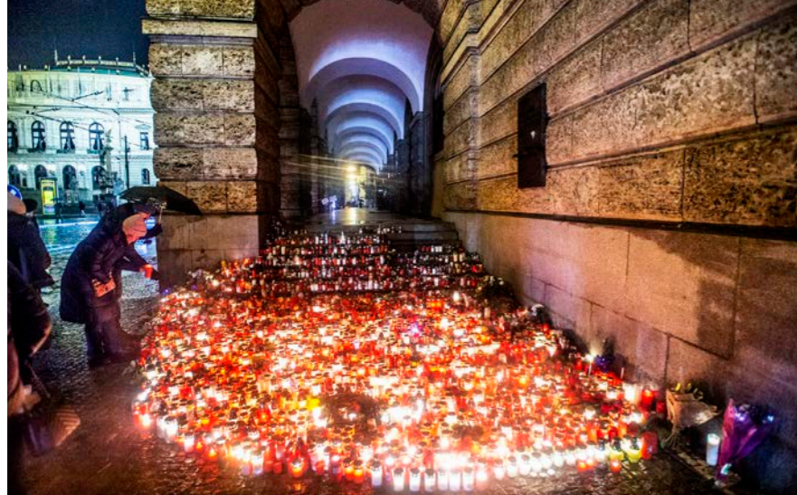
22. 12. & 23. 12. 2023 Lidé den po tragédii na FF UK přinášeli a zapalovali svíčky u brány Karolína a před budovou Filozofické fakulty na Palachově náměstí.