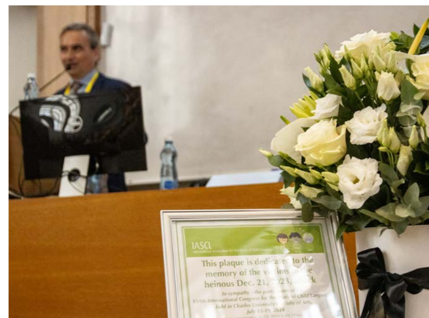
15.–19. 7. 2024 Obnovu akademického života na FF UK také v mezinárodním hledisku potvrdil i Mezinárodní kongres pro studium dětského jazyka. Organizátoři věnovali FF UK kondolenční kytky, která byla po dobu celé konference vystavena v aule hlavní budovy.