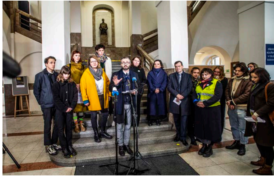
21. 1. 2024 Měsíc po tragédii se poprvé do hlavní budovy FF UK vrátili studující i vyučující, konaly se krátké přednášky i výměna knih. Na doporučení psychologů se takto postupně do budovy navrátil akademický život a posílily vazby komunity.